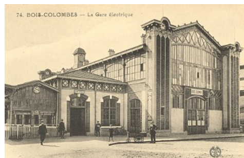
1924 à Asnières (Gare de Bois-Colombes)

proposée par le Service de la Culture d'Asnières-sur-Seine avec le concours de l'Association Frères Lumière