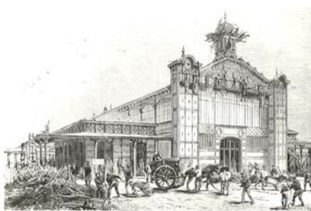
1878 Avenue de Suffren – 15e

Entrée libre dans la limite des places disponibles